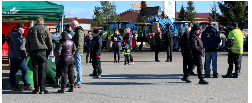
AgriHuittinen sai jälleen kerran mukavasti väkeä liikkeelle.

”Tällä hetkellä pääsääntöinen asiakaskuntamme koostuu kotitalouksista, joiden mattoja ja kodintekstiileitä pesemme. Tilat mahdollistaisivat kuitenkin ehdottomasti myös yhteistyön yritysten kans-