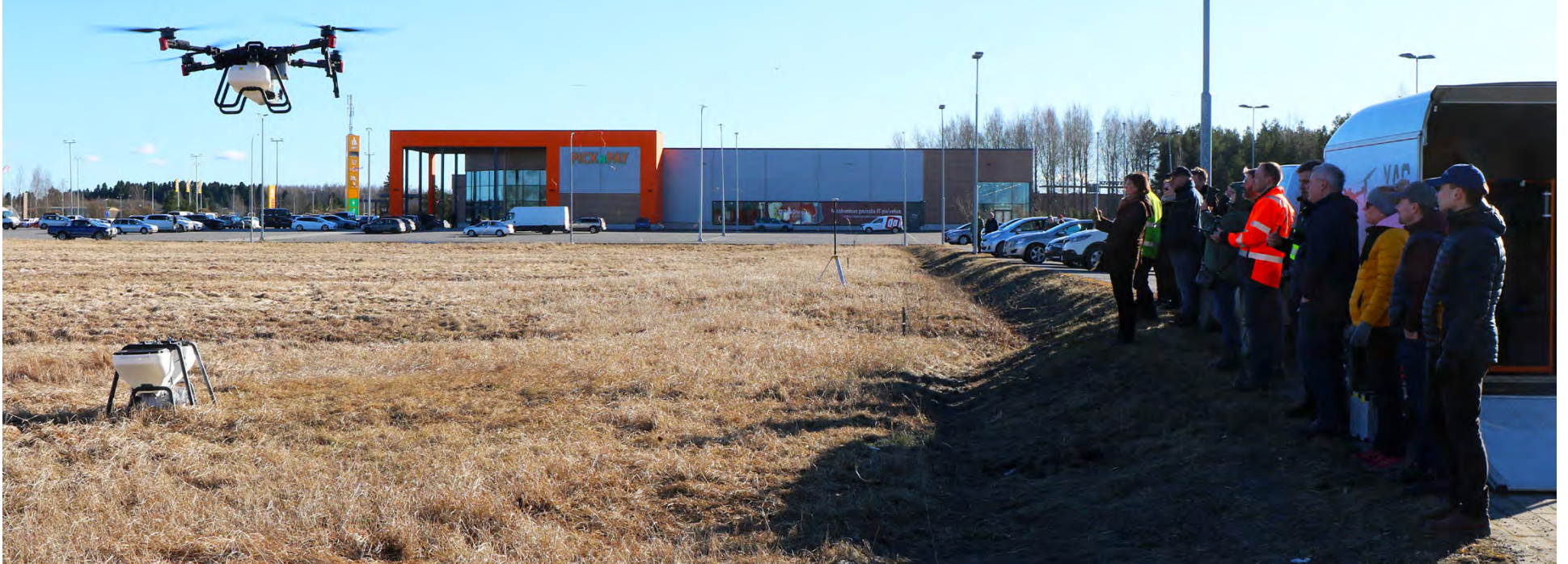
Uusi tekniikka kiinnostaa maatalousalan tapahtumissa aina. Sähkössä ollut maatalousdronen lentonäytöstä seurasi runsaasti yleisöä.