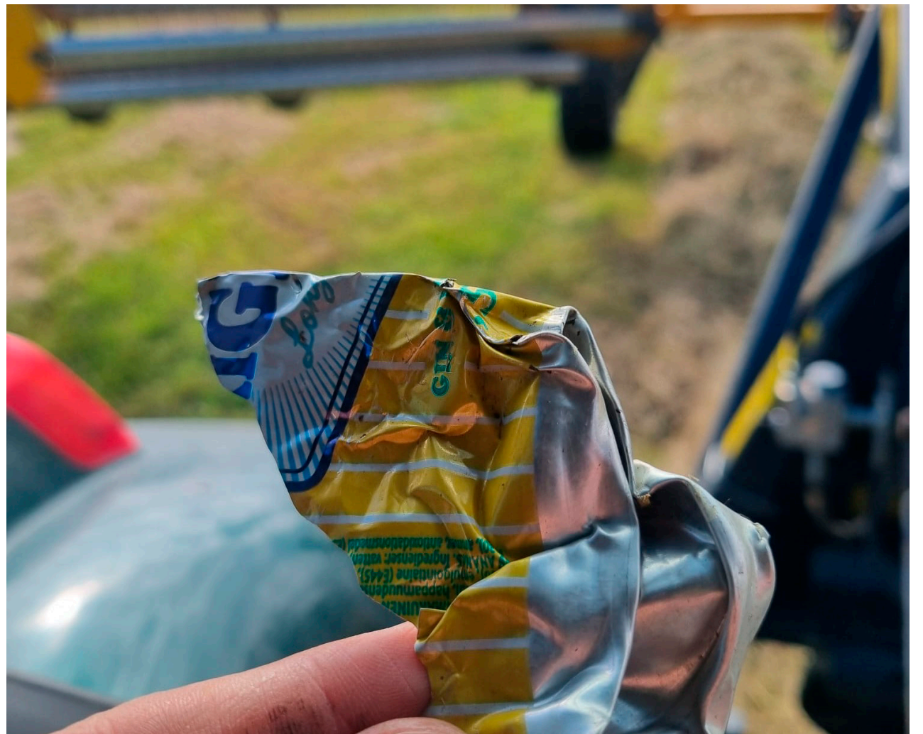
Lehmälle pellolle päätyneen roskan, vaikkapa juomatölkin, aiheuttamat sisäelinvauriot merkitsevät kovaa kipua.

Yksinkertaisilla arkisilla teoilla kuten jättämällä roskat heittämättä ja poimimalla ympäristöön päätyneitä jätteitä talteen, jokainen voi kantaa kortensa kekoon ja estää laiduntavien lehmien ja muiden eläinten kärsimyksen.